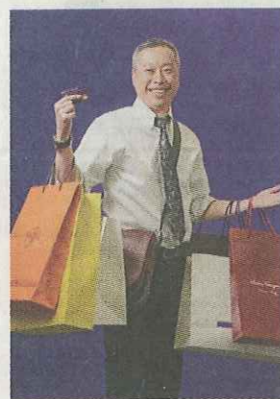
家庭醫生睇醫生 自測購物狂