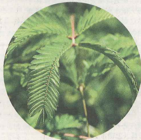
合葉草 蕨底藏「閱木」